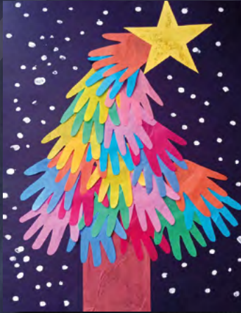
Weronika Zalewska – kl. 0 SP Wiśniew