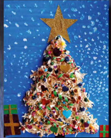
Oliwia Rudnicka – kl. 1 SP Jakubów